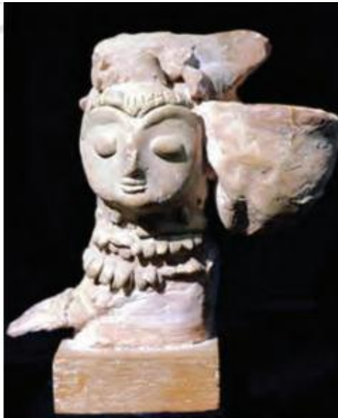
मिट्टी से बनी आकृति

जाता था। इसके बाद चिकनी मिट्टी के खाली सांचे में उसी छेद के रास्ते पिघली हुई धातु भर दी जाती थी। जब वह धातु ठंडी होकर ठोस हो जाती थी तो चिकनी मिट्टी के आवरण को हटा दिया जाता था। कांस्य में मनुष्यों और जानवरों दोनों की ही मूर्तियाँ बनाई गई हैं। मानव मूर्तियों का सर्वोत्तम नमूना है एक लड़की की मूर्ति, जिसे नर्तकी के रूप में जाना जाता है। कांसे की बनी हुई जानवरों की मूर्तियों में भैंस और बकरी की मूर्तियाँ विशेष रूप से उल्लेखनीय हैं। भैंस का सिर और कमर ऊँची उठी हुई है तथा सींग फैले हुए हैं। सिंधु सभ्यता के सभी केंद्रों में कांसे की ढलाई का काम बहुतायत में होता था। लोथल में पाया गया तांबे का कुत्ता और पक्षी तथा कालीबंगा में पाई गई साँड़ की कांस्य मूर्ति को हड़प्पा और मोहनजोदड़ो में पाई गई ताँबे और कांसे की मानव मूर्तियों से किसी प्रकार भी कमतर नहीं कहा जा सकता।